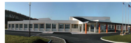
北海道北見支援学校